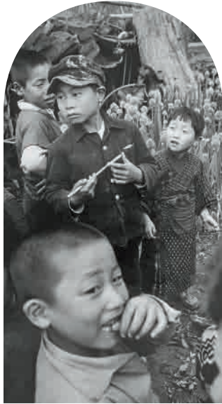
木村伊兵衛「子供たち・秋田市仁井田」1952年 展示期間:2期