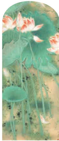
広島見南「紅蓮図」1921年 展示期間:3期