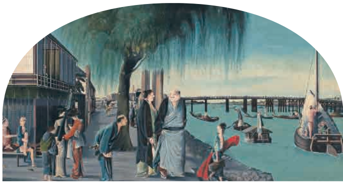
亜欧堂田善「两国図」江戸時代 展示期間:1期

前身の秋田市美術館時代から60年以上にわたり収集してきた秋田市立千秋美術館のコレクション約1600件の中から、代表的な作品約200件を、1期「秋田蘭画・岡田謙三」、2期「洋画・写真」、3期「日本画」に分けて紹介。リニューアルにより生まれ変わった展示室で、当館の所蔵品の魅力を余すところなくご覧いただけます。