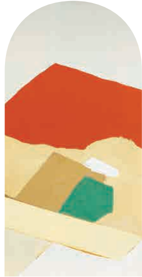
岡田謙三「朱」1962年 展示期間:1期